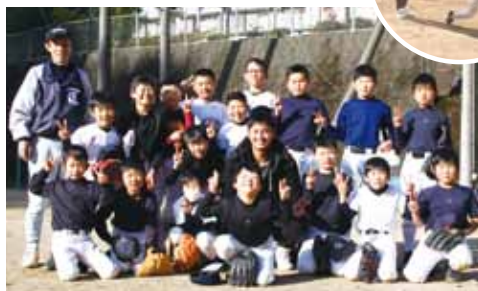
みんなで記念撮影「はい、チーズ!」