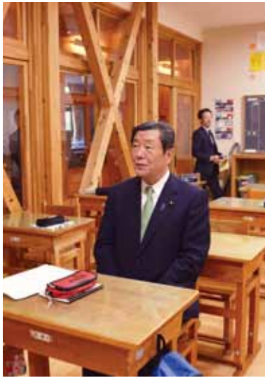
十津川中学校の教室で

農林水産大臣に、村の取り組みを見ていただき、評価いただいたことは、林業・木材産業に関わる人にとって、大変励みになるものでした。